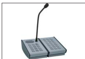
Digitální stanice hlasatele DCS15 a digitální klávesový modul DKM18