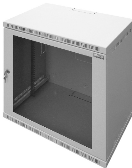
posuvné víko kabelového prostupu