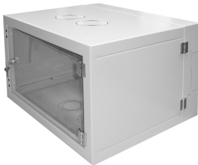
posuvné víko kabelového prostupu

(skelet šířky 600mm, hloubky 500mm a výšky 06U , barva 7035)-.-.ks