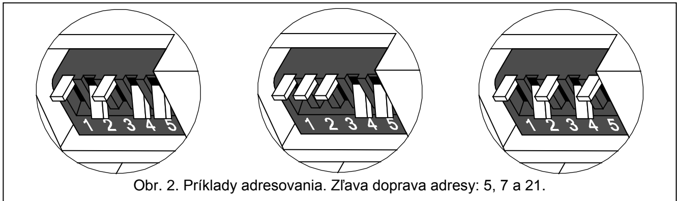
Obr. 2. Príklady adresovania. Zľava doprava adresy: 5, 7 a 21.

Päť prepínačov umožňuje nastaviť adresy 32 expandérom (hodnoty od 0 do 31). Adresy expandérov pripojených na jednu linku sa nesmú opakovať, postupnosť adresovania je ľubovoľná. Odporúča sa priradovať expandérom a modulom pripojeným na jednu linku adresy začínajúce od nuly. Umožní to vyhnúť sa problémom počas rozširovania systému.