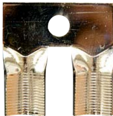
DPR 06 praporec dvojitý 1 V.D.