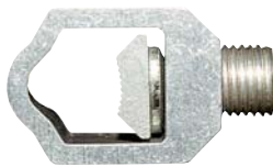
V - svorka 6 - 120 mm 2