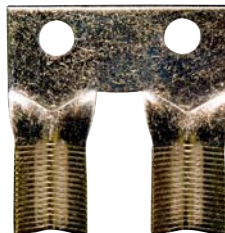
DPR 02 praporec dvojitý 2 M.D.