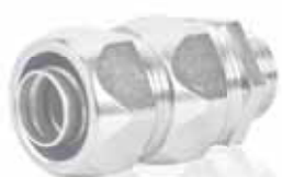
Hadicová vývodka AM RP MF