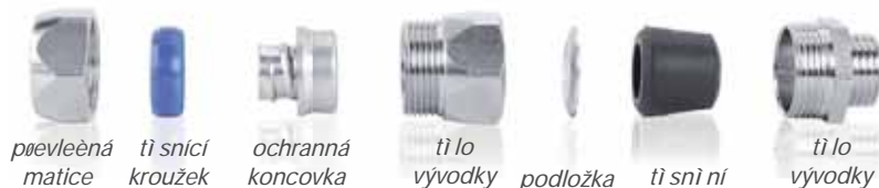
převlečná matice těsnící kroužek ochranná koncovka tělo vývodky podložka těsnění tělo vývodky