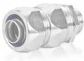
Hadicová vývodka AM RP FF