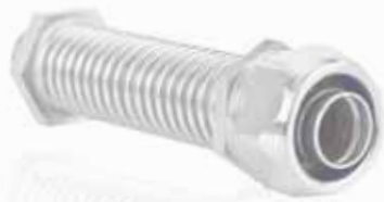
Úhlová hadicová vývodka AM MF