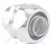
Hadicová vývodka AM FF