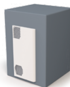
Plně zapuštěná montáž