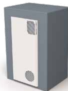
Plně zapuštěná montáž