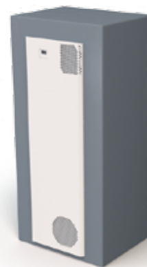
Plně zapuštěná montáž