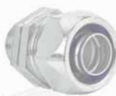
Hadicová vývodka AM MG