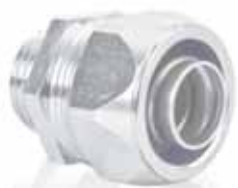
Hadicová vývodka AM MF