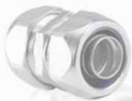
Hadicová vývodka AM GG