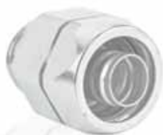
Hadicová vývodka na ochrannou hadici

Pro použití s hadicí DMC HJT-L na straně 18.